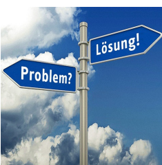
› Webseite der Sozialberatung ( https://www.studentenwerk-magdeburg.de/soziales/sozialberatung/ )

Die Beauftragte für wissenschaftliches Fehlverhalten informiert, berät und unterstützt bei Fragen zum Thema wissenschaftliches Fehlverhalten. Hierzu zählt beispielsweise, wenn eine Person "in einem wissenschaftserheblichen Zusammenhang vorsätzlich oder grob fahrlässig Falschangaben macht, sich fremde wissenschaftliche Leistungen unberechtigt zu eigen macht oder die Forschungstätigkeit anderer beeinträchtigt." (› Verfahrensordnung zum Umgang mit wissenschaftlichem Fehlverhalten (VerfOWF) der DFG ( https://www.dfg.de/formulare/80_01/80_01_de.pdf )).